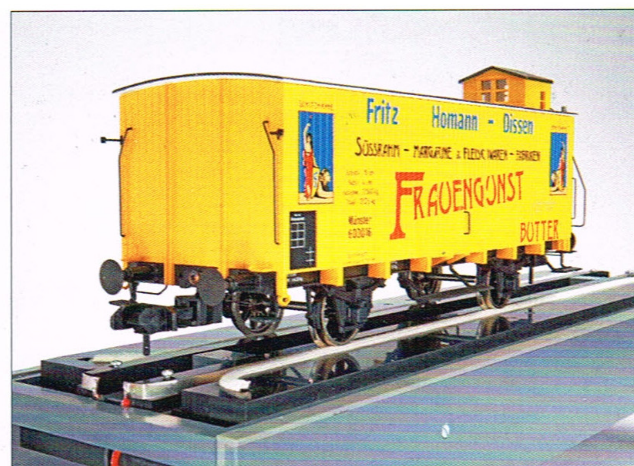
► LUX: Radreinigungsanlage für 1

19 Meter Bühnenlänge (60 cm). Passend dazu gibt es Patinierungen, eine digitale Direktsteuerung, Messing-Schienenstühle, einen funktionsfähigen Kurbelkasten mit Mikrozahnrädern, eine neue Rahmenwange und vieles mehr. Ab Herbst will das Unternehmen eine ebenso detaillierte Drehscheibe für 0 ausliefern. Passend zu Gartenbahnen kommt bereits im Sommer eine günstige wetterfeste Variante mit 60 cm Länge, die optional umfassend detailliert werden kann. Neu ist auch eine Gitterkastenbrücke in 1 mit 60 cm Länge.