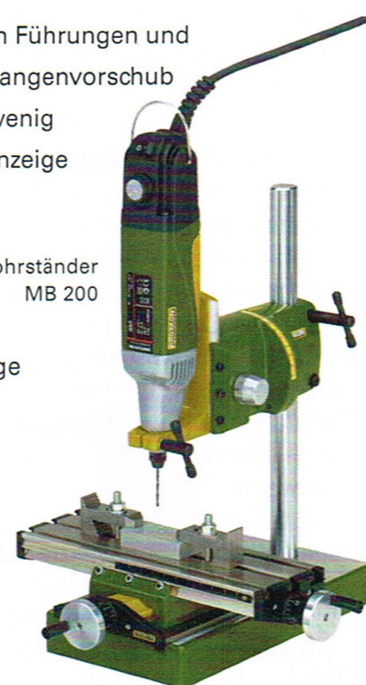
Koordinatentisch KT 70

Bitte fragen Sie uns. Katalog kommt kostenlos.