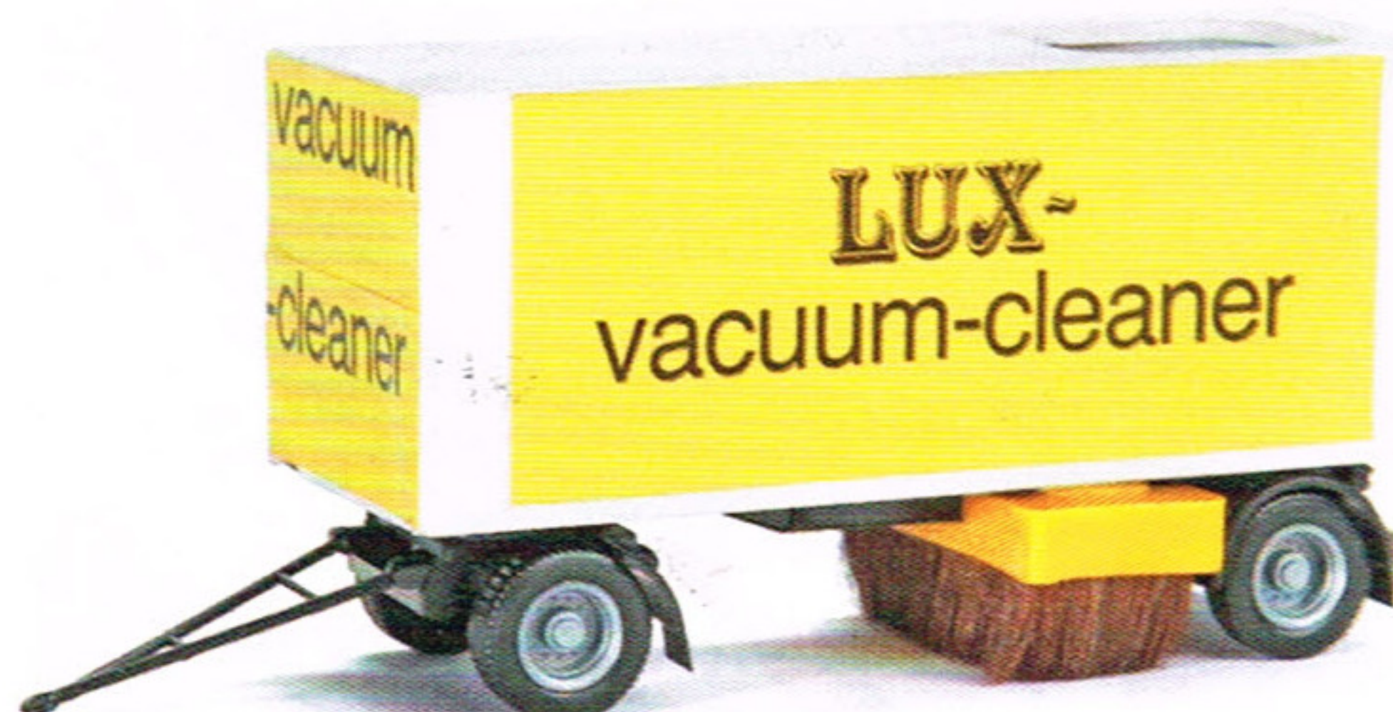
▲ LUX: Straßenreinigungswagen mit Staubsauger für Faller Car System

Für Spur 1 kommt jetzt die Bundesbahn-/Reichsbahn-Drehscheibe mit